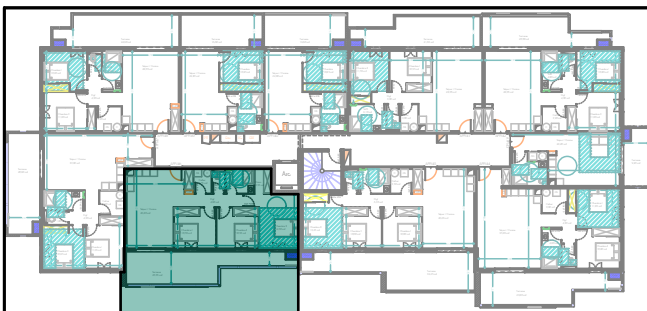
Plan de localisation R+4