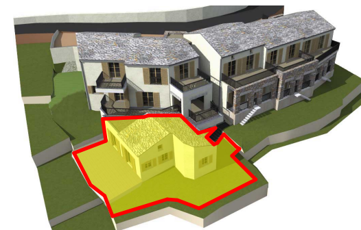
Localisation du logement et du jardin