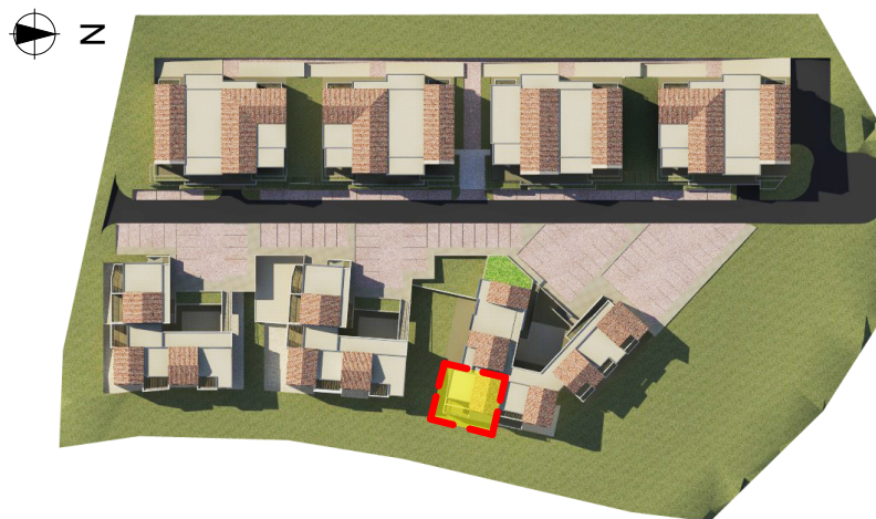
Localisation sur plan de masse