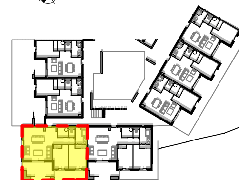
Localisation dans bloc E