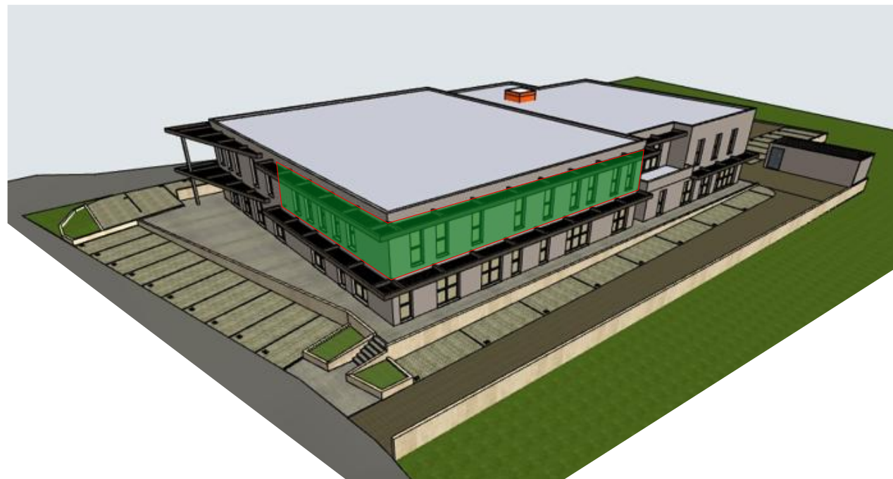
LOCALISATION LOT 011