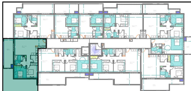
Plan de localisation R+1