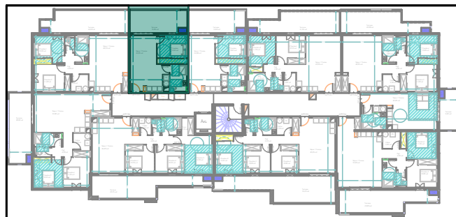
Plan de localisation R+3